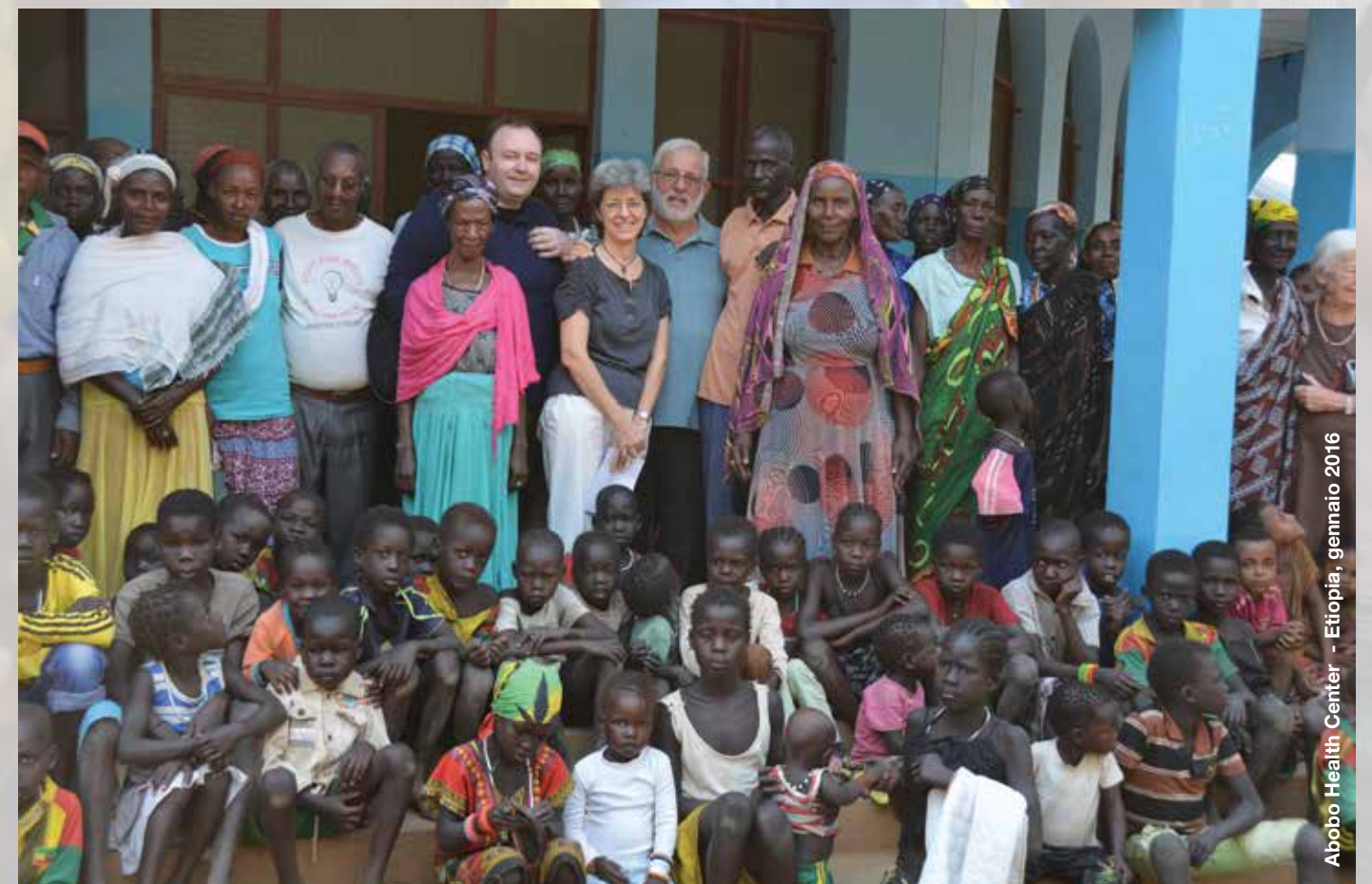
Abobo Health Center - Etiopia, gennaio 2016